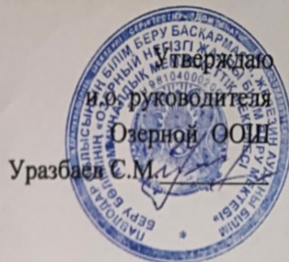
График проведения СОР и СОЧ на 2021-2022 учебный год III – четверть